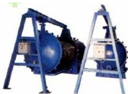
Горизонтальный напорный листовой фильтр (со сдвигом корпуса) для химической промышленности