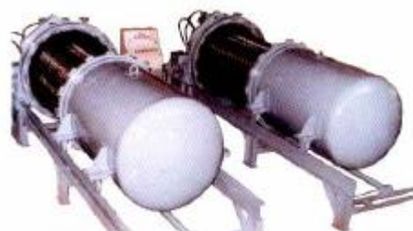
Горизонтальный напорный листовой фильтр (со сдвигом корпуса) для фильтрации восков на предприятии по производству пищевых масел